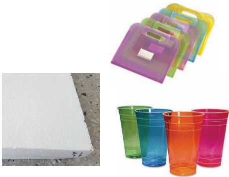
รูปที่ 3 ผลิตภัณฑ์จากพอลิสไตรีน