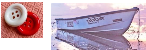
รูปที่ 5 ผลิตภัณฑ์จากพอลิเอสเทอร์เรซิน

การใช้งาน : จาน ชาม แก้วน้ำ ของใช้ในครัวเรือน กระดุม กระดานขาลบได้ เครื่องเด็กเล่น อุปกรณ์ตกแต่งสวน ถึงขนาดใหญ่ ลำเรือ