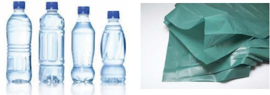
รูปที่ 4 ผลิตภัณฑ์จากพอลิเอทิลีน