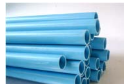
รูปที่ 1 ผลิตภัณฑ์จากอะคริลิก