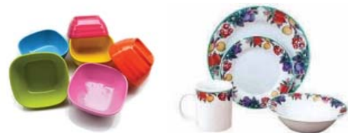
รูปที่ 6 ผลิตภัณฑ์จากเมลามีน